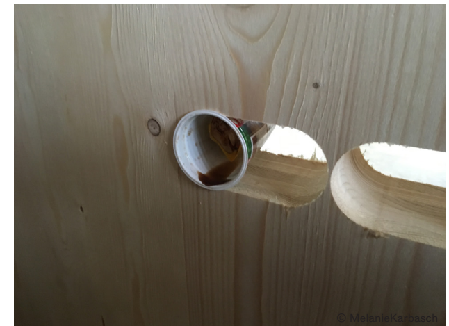
Sichtbare Holzoberflächen . Ausbau