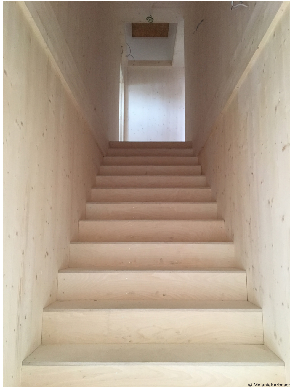
Sichtbare Holzoberflächen . Ausbau