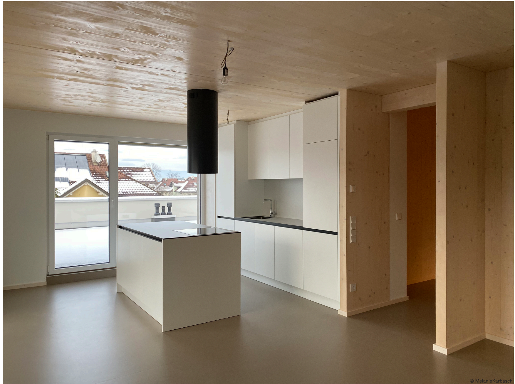
Sichtbare Holzoberflächen . nach Fertigstellung