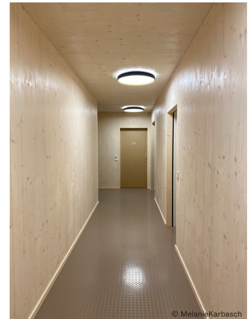
Sichtbare Holzoberflächen . nach Fertigstellung