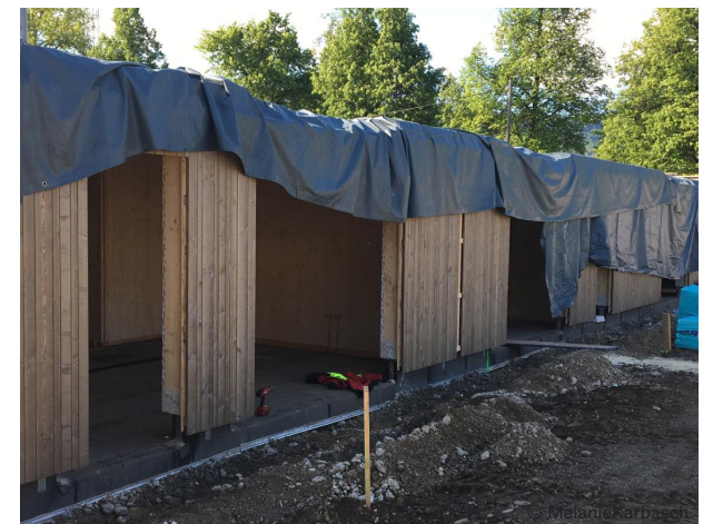
Sichtbare Holzoberflächen . Bauphase